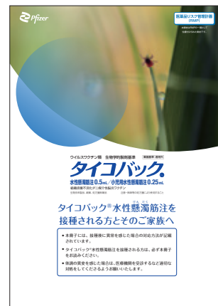
『タイコバック®水性懸濁筋注を接種される方とご家族へ』